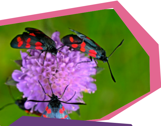
Widderchen auf einer Witwenblume. Sie leben auf Magerrasen und bevorzugen lila Blüten.