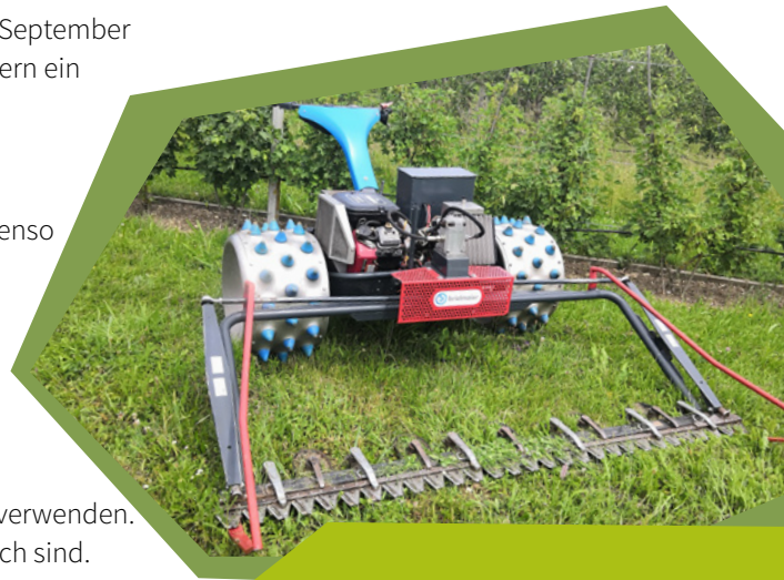
Handgeführter Balkenmäher mit Doppelmesser durch spezielle Bereifung auch im hängigen Gelände einsetzbar.